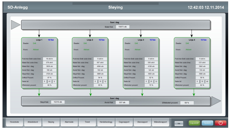
Statusoversikt som viser produksjonsdata hittil i dag.

The Boss genererer og sender automatisk rapporter over dagens produksjon til utvalgte personer i bedriften.